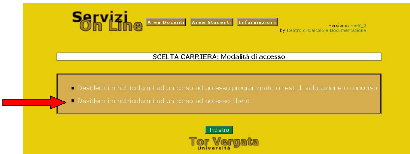
Figura 6 – Scelta immatricolazioni ad accesso libero