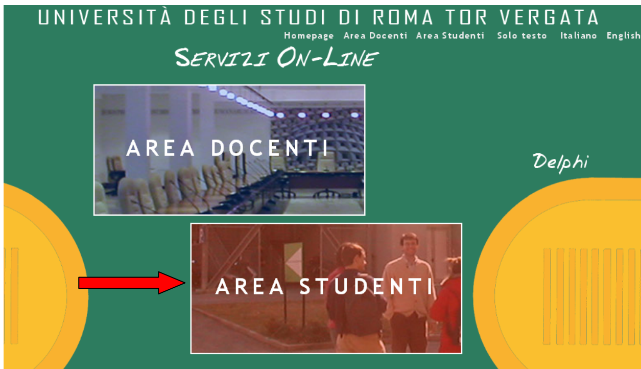
Figura 1 – Accesso Area studenti