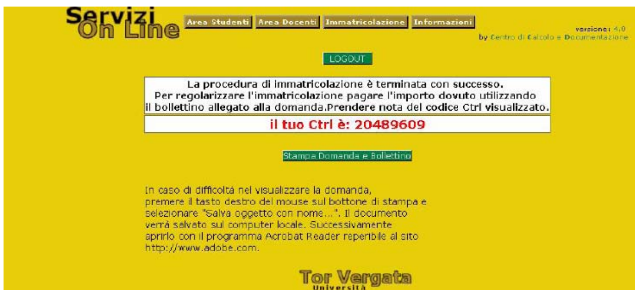
Figura 7 - Stampa domanda e bollettino