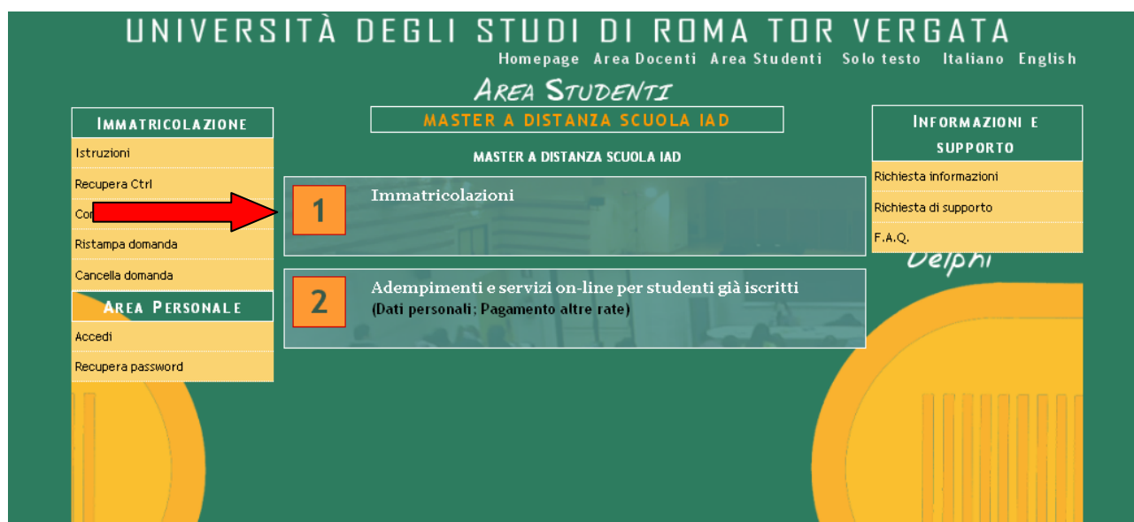
Figura 5 – Inizia procedura immatricolazione

5. Di seguito cliccare al punto 1 su "immatricolazioni" come da figura 5.