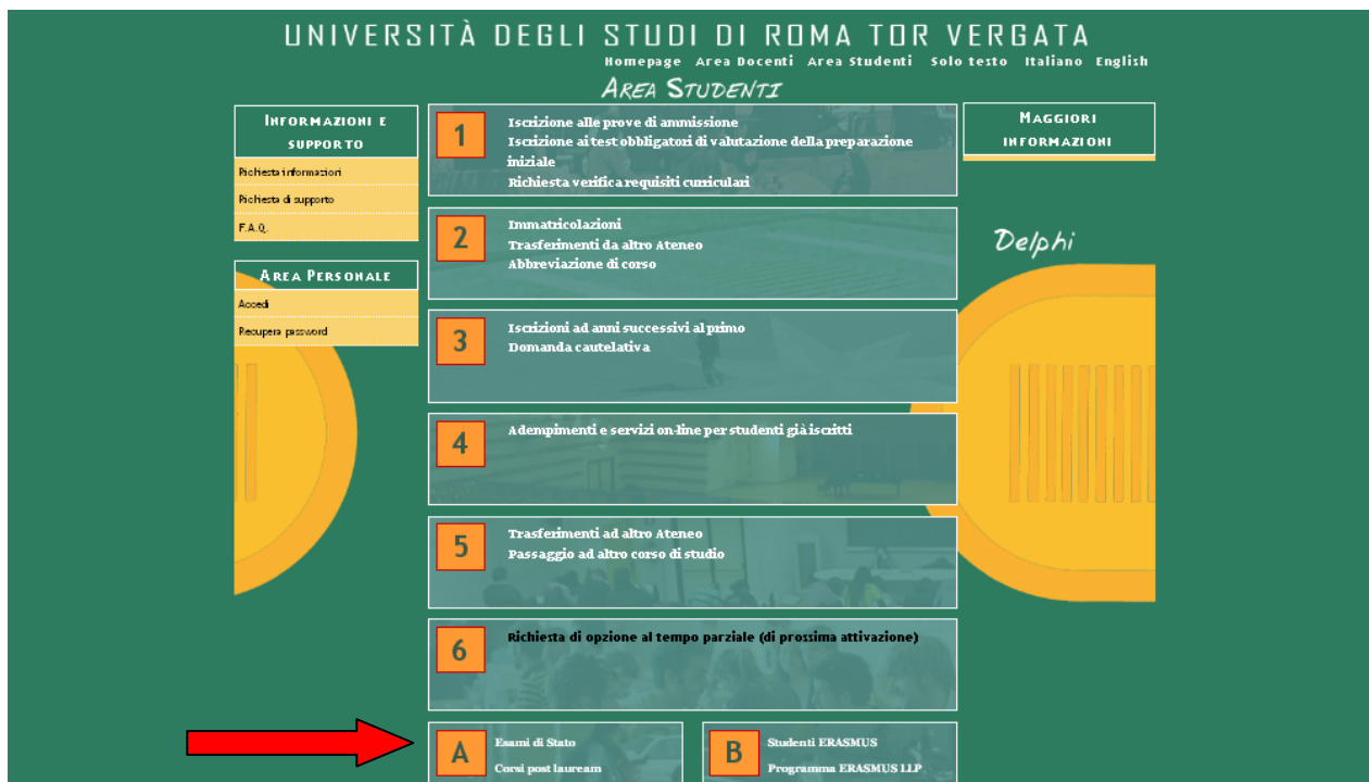
Figura 2 – Scelta corsi post lauream